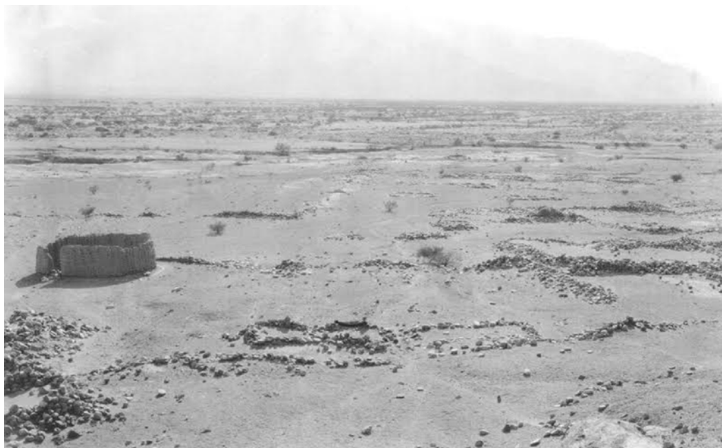
Figura 1. Watungasta fotografiada por Weisser en 1925; aún en ruinas, las estructuras del sitio permiten apreciar la variabilidad de sistemas constructivos empelados en el sitio en diferentes momentos de su historia (Archivo de la División Arqueología, Museo de La Plata).

Interesantemente, trabajos realizados en Watungasta décadas después establecieron que si bien la adscripción realizada por Weisser de todos los elementos de adobe a tiempos históricos no era correcta, sí lo fue su percepción de que los distintos conjuntos constructivos presentes en el sitio dan cuenta de la superposición de dos patrones de poblamiento, el primero correspondiente a una ocupación indígena y el segundo a una española (Sempé 1983:603). El momento indígena presenta una amplia variación de técnicas constructivas y materias primas, con estructuras de piedra y adobe que forman núcleos complejos en las inmediaciones de los cerros, mientras que la influencia española está representada por construcciones dispersas de muros de adobe con ventanas y ubicadas a mayor distancia de la base de los mismos (Sempé 1983:603).