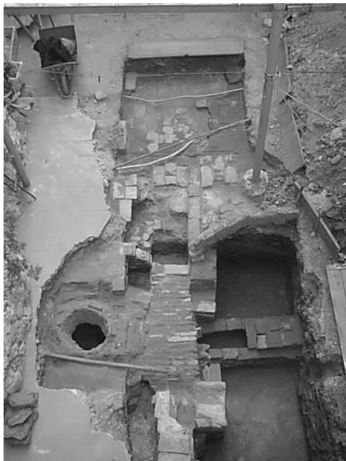
Figura 1. Casa Fernández Blanco, Avenida Hipólito Yrigoyen 1420 (CABA, Argentina). Vista superior general de las excavaciones. Se observan distintas estructuras de los siglos XIX y XX que se superponen.

En fin, los arqueólogos comenzaron a investigar los asentamientos urbanos ubicados en la actual Argentina sobre todo durante la segunda mitad del siglo XX. A veces en asentamientos humanos que luego quedaron totalmente abandonados, que no tuvieron continuidad en el tiempo, y que en su momento de vida fueron ocupaciones urbanas pero que actualmente son sitios que han quedado en medios rurales como los tells (Childe 1974: 55 y 178) o tepe -o höyük como Çatalhöyük- del Cercano Oriente (entre otros, Childe 1974; Molist 1996; Renfrew y Bahn 1998), o los pueblos pampeanos abandonados, como Mariano Miró (Landa et al. 2014) también llamados pueblos fantasma o Ghost Town -en inglés- (Lawrence y Davies 2010; Peyton 2012; Landa et al. 2014). Hubo otros casos casi opuestos, como las ocupaciones rurales que fueron fagocitadas por la expansión de ciudades como Buenos Aires, como las casas de los pueblos de Belgrano o Flores (Camino 2008, 2011) y que ahora son parte de la gran ciudad.