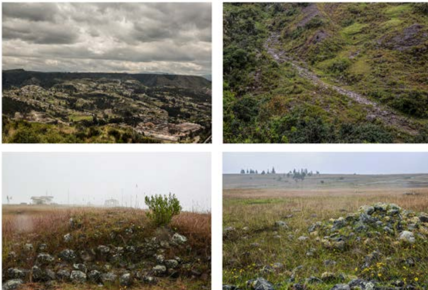
Figura 13. Arriba, izquierda: Panorámica del cerro Pachamama, visto desde la ciudad de Cuenca. Arriba, derecha: parte del Camino Inca, en el acceso al cerro Pachamama. Abajo, izquierda: restos de muros arqueológicos en la planicie del cerro Pachamama. Abajo, derecha: Restos arqueológicos en la planicie del cerro Pachamama.