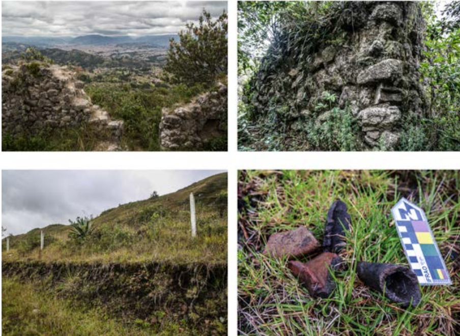
Figura 9. Arriba, izquierda: vista panorámica de la ciudad de Cuenca, desde el interior de la edificación. Arriba, derecha: vista del muro (piedras de canto rodado y quillucaca) de, aprox. 2 metros de altura. Abajo, izquierda: restos cerámicos en la tierra removida. Abajo, derecha: restos cerámicos en el cerro Guagualzhumi.

A 8 km de Pumapungo en dirección sureste, aproximadamente, se impone la colina de Jalshi (figuras 10 y 11). La parte superior de ésta forma una planicie, pues actualmente se construyó una cancha de fútbol y un camino de ingreso. Estas construcciones alteraron el espacio y destruyeron el contexto con cerámica arqueológica, que se percibe en toda la extensión de la explanada.