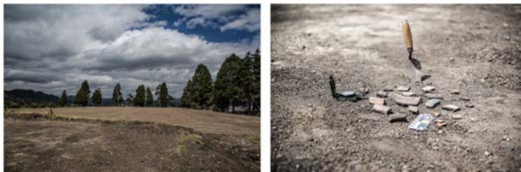
Figura 11. Colina de Jalshi. Izquierda: vista panorámica del sitio. Derecha: Fragmentos de cerámica dispersos en el sitio arqueológico.

La meseta de Pachamama 2800 msnm (figura 12 y 13) está ubicada en el límite provincial entre Azuay y Cañar –a 17 km de Cuenca–. Constituye una formación natural que fue ocupada en diferentes etapas históricas, siendo visibles los restos materiales tanto de cerámica, lítica, arquitectura, entre otros, que se distribuyeron en zonas altas como en las zonas bajas inmediatas a la meseta (Novillo y Vargas, 2015).