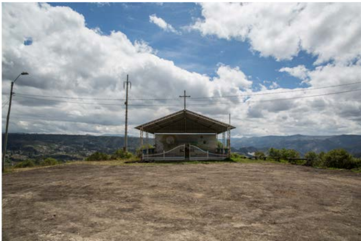
Figura 10. Colina de Jalshi. Sitio arqueológico destruido por acción antrópica.

A 8 km de Pumapungo en dirección sureste, aproximadamente, se impone la colina de Jalshi (figuras 10 y 11). La parte superior de ésta forma una planicie, pues actualmente se construyó una cancha de fútbol y un camino de ingreso. Estas construcciones alteraron el espacio y destruyeron el contexto con cerámica arqueológica, que se percibe en toda la extensión de la explanada.