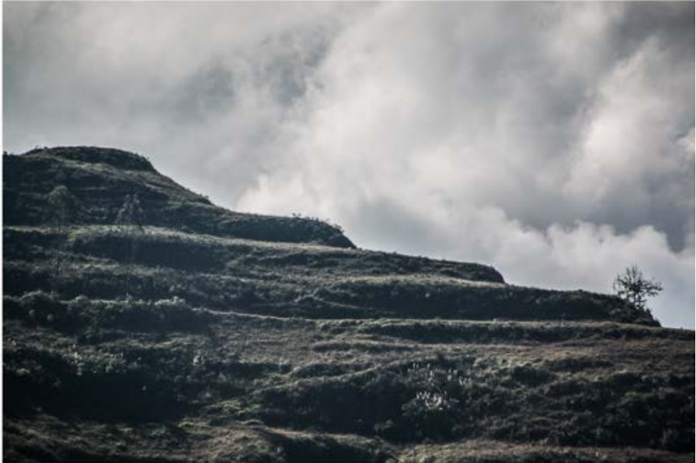
Figura 6. Cerro Monjas, terrazas.

En el área rural encontramos el sitio denominado Cerro Monjas (figuras 6 y 7) que se localiza a 4 km de Pumapungo, en dirección suroeste. A nivel superficial se localizan fragmentos cerámicos, además de presentarse en la parte sur de la colina a manera de terrazas, que manifiestan una forma piramidal. Por otra parte, en la parte superior del cerro se conserva una plataforma que conecta dos montículos trabajados, con evidencia cerámica. Al sur del cerro Monjas se encuentra otra elevación conocida como Boquerón, la cual es considerada como parte integral de la geografía sagrada y que se mantiene en la memoria de la comunidad.