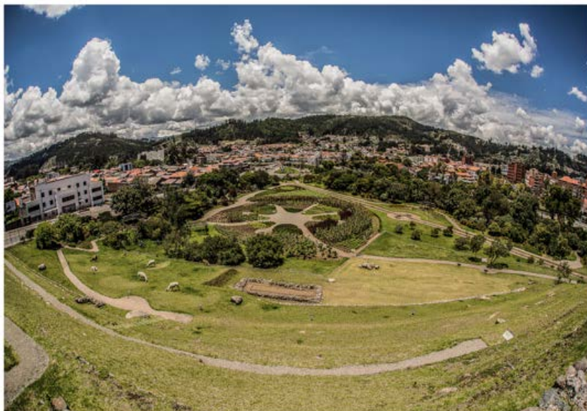
Figura 2. Sitio arqueológico Pumapungo.