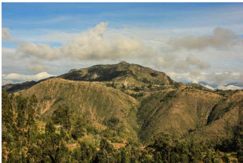
Figura 8. Panorámica del Cerro Guagualzhumi. Fotografía Juan Carlos Astudillo.

El sitio conocido como Guagualzhumi (figuras 8 y 9) está localizado al sureste de Pumapungo, a 9 km de distancia. Este constituye un área significativa con elementos culturales importantes: en las faldas del cerro se encuentra el denominado Curitaqui, cueva que según la tradición oral se conecta con Cojitambo. La presencia cerámica y lítica en el área evidencia una ocupación prehispánica. Además, existen otras áreas asociadas como el Plateado, donde se disponen materiales arqueológicos en superficie (cerámica). Finalmente, existe una estructura denominada como Chapana Wasi (casa de vigilancia), la cual posiblemente servía como punto de control.