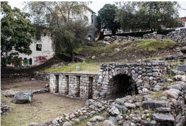
Figura 4. Estructuras del sitio arqueológico Todos Santos.