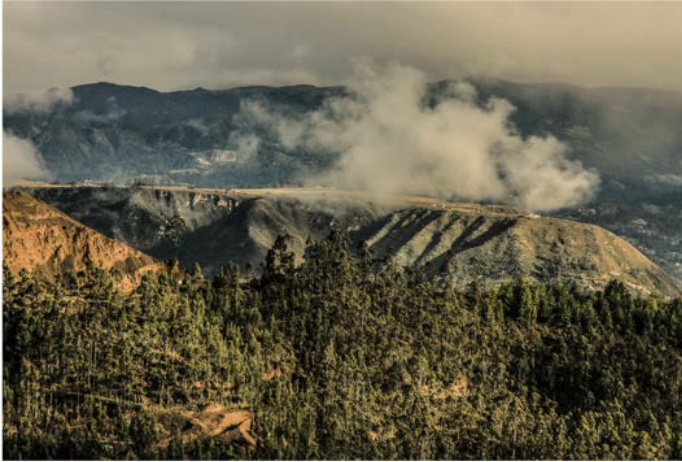
Figura 12. Panorámica del cerro Pachamama.

En general, la meseta de Pachamama y sus zonas aledañas representa un área de sumo interés para la arqueología, que debe ser analizado a partir del contexto espacial y con sustento teórico que genere nuevas interpretaciones de los asentamientos prehispánicos en la región.