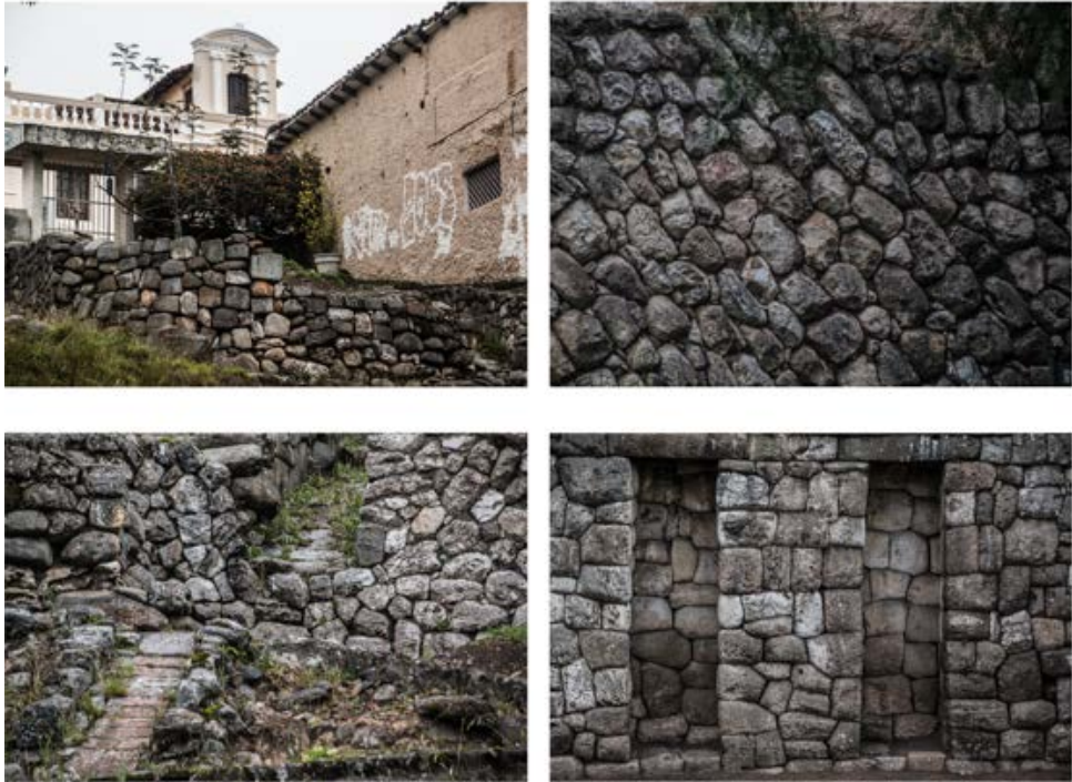
Figura 5. Detalles y plano general del sitio arqueológico Todos Santos.