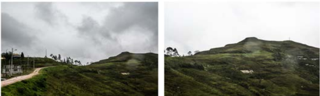
Figura 7. Izquierda: acceso al cerro Monjas. Derecha: panorámica del cerro Monjas y sistema de terrazas en el mismo.