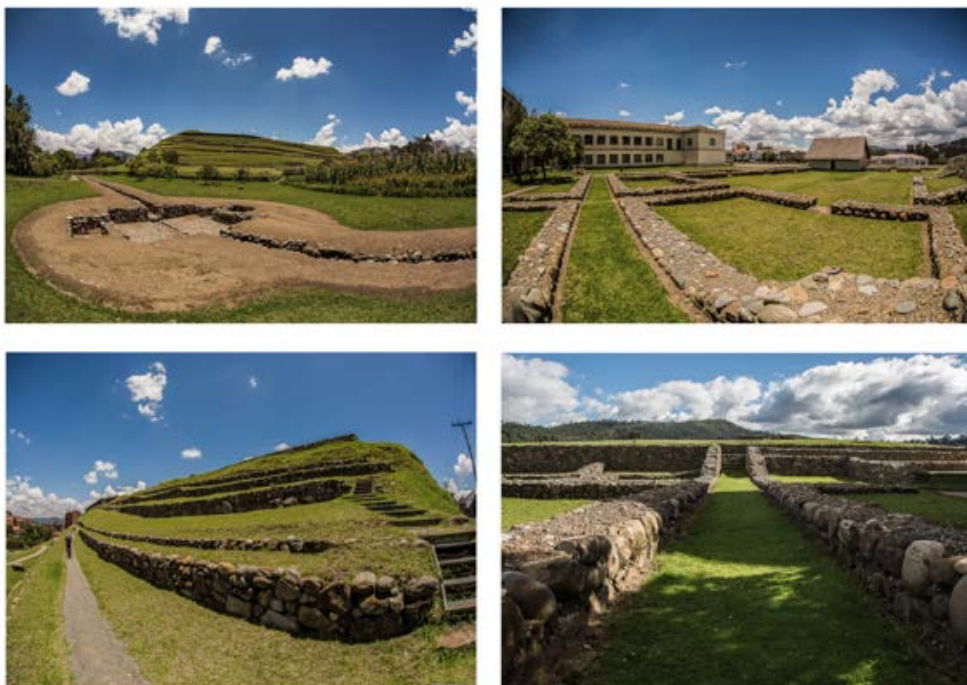
Figura 3. Estructuras del sitio arqueológico Pumapungo. Arriba, izquierda: canales de riego; arriba, derecha: posibles viviendas/kallancas; abajo, izquierda: terrazas; abajo, derecha: acceso al Qorikancha.