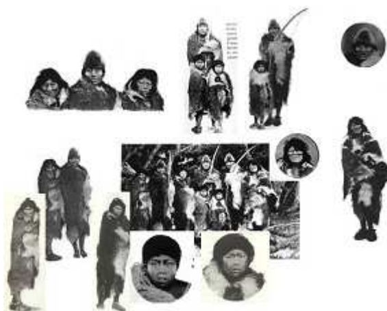
Foto-collage 11. Fragmentos de fotografía publicados por Gallardo (1910: 1, 2, 16, 99, 106, 145, 151, 235, 237, 250, 380).