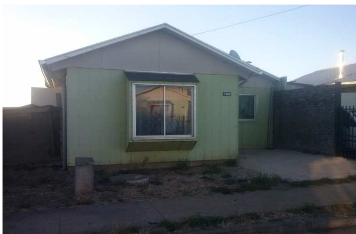
Figura 2: Fotografía Villa "Rayen Mapu"