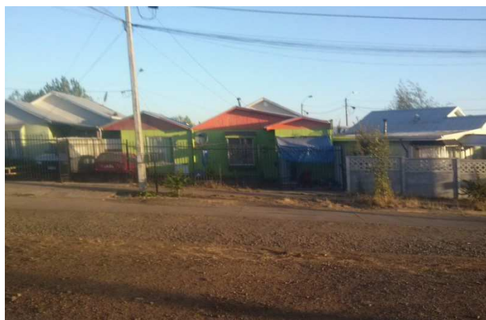
Figura 3: Fotografía Villa "Rayen Mapu"