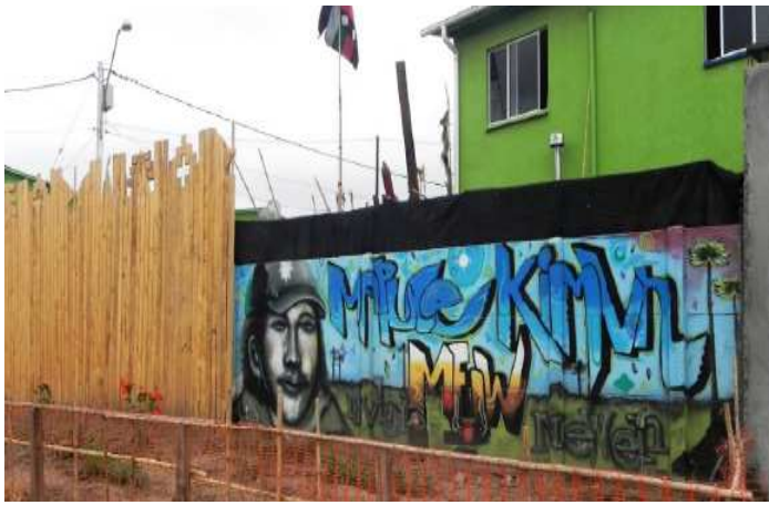
Figura 6: Villa Bicentenario