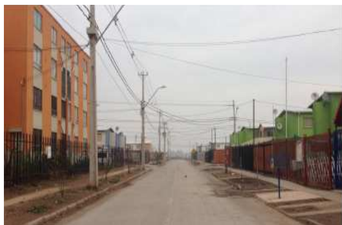
Figura 5: Villa Bicentenario