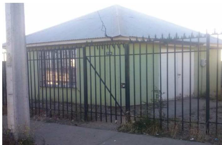
Figura 4: Sede social, Villa Rayen Mapu