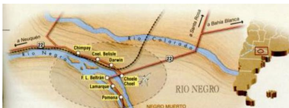
Imagen 1: El Valle Medio del río Negro