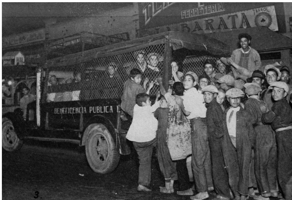
Imagen 1. Niños sin hogar que dormían en el arroyo. Abordando el automóvil de la beneficencia pública para dirigirse al dormitorio. Velasco, Niño , 1935.

La primera fotografía nos presenta a numerosos niños abordando los camiones que se pusieron a disposición de la beneficencia para sus recorridos en la noche. La imagen muestra la cara sonriente de los niños y su afán de subir al camión, la mayoría de ellos luce ropa desgastada y desaliñada, y casi todos están descalzos. En la segunda foto se muestra a los niños formados para poder entrar a los dormitorios, cada uno tiene una manta la cual les era proporcionada por el establecimiento y tenían que devolver a su salida. No obstante, la última foto muestra un cambio total que se puede observar desde el pie de foto: “niños ex mendigos”. En esta imagen se muestra a los niños mejor arregla-