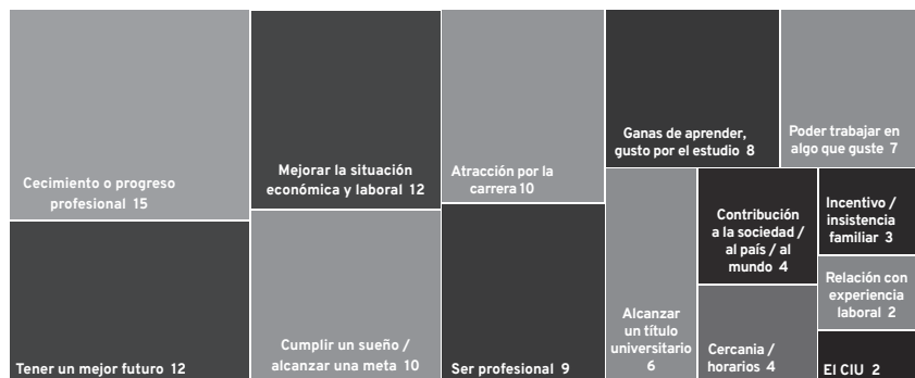
Gráfico 2. Motivos para seguir una carrera universitaria (% sobre total de estudiantes).

Nota: se codificaron 505 respuestas abiertas brindadas por las y los estudiantes.